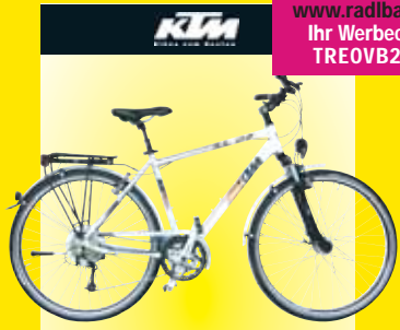
Trekkingrad 'Veneto Super Light'