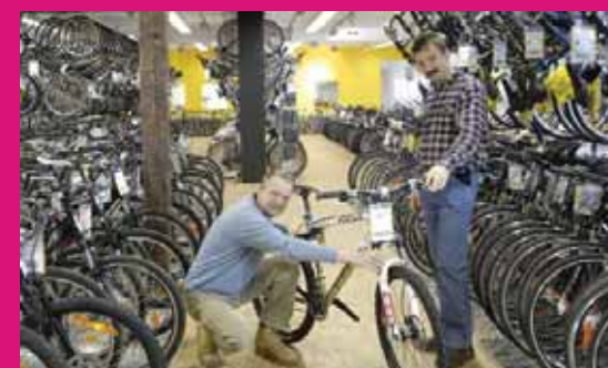
RADLBAUER im Circus Krone

Das Fachgeschäft für hochwertige Räder Paul-Heise-Str. 25, Nähe Hbf, Tel. 089 - 53 11 09 Mo bis Fr 10-19 Uhr, Samstag 10-18 Uhr